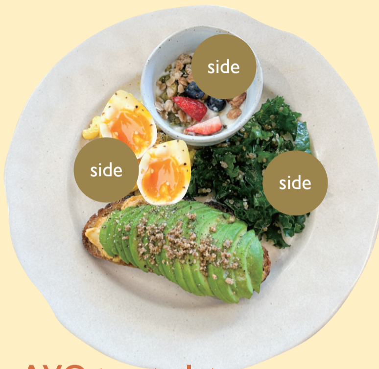
AVO toast plate (VV) 1,760