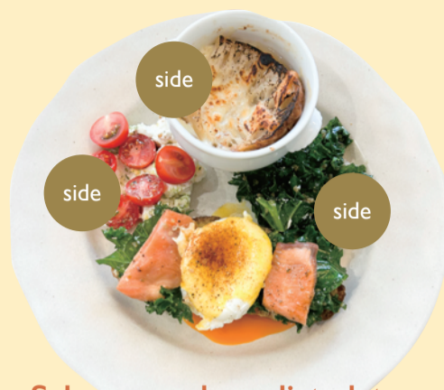
Salmon egg benedict plate 1,790